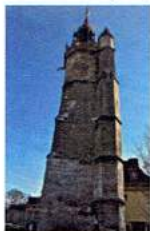
Evreux — Le Beffroi