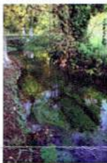
Evreux — L'Îton