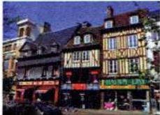
Evreux — Maisons à colombage