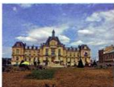
Evreux — Hôtel de Ville