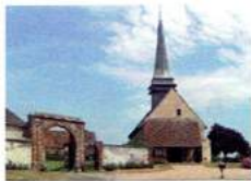
Eglise de Coudres