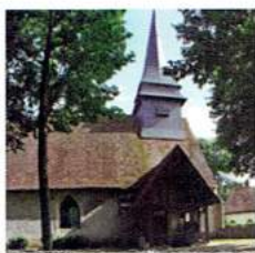
Église Notre-Dame de Illiers l'Évêque