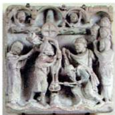
Bas-relief Roman — Église de Coudres