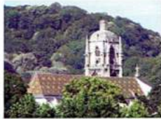
G - Église St-Jean de Elbeuf — XV ème s.