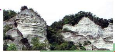
E - La Roche Foulet — Orival