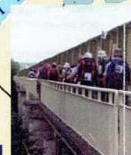
F - le pont S.N.C.F.