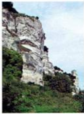
C - La Roche du Pignon — Oissel