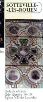
Détails vitraux Église Guerre 14-18 Église ND de Lourdes