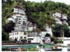
D - La Roche Foulet — Orival