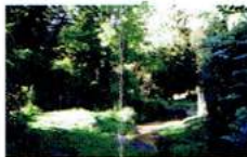
3 - Gare de Yassoville