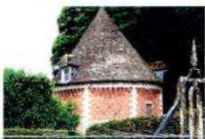
G - Pigeonnier à machicoulis du château du Fosse