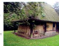
8 - Le double four à pain