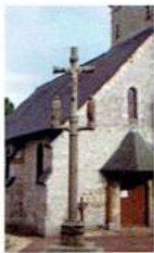
A - Calvaire breton de St Denis sur Scie