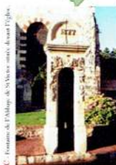
5 - Fontaine de l'Abbaye de St-Victor au sud d'Étampuis