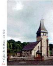
2 - Église de St Denis sur Scie