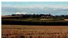
D - GR 210 - Regard vers La Folie