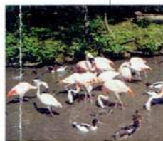
7 - Le parc - Flamants roses