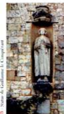
4 - Statue de Guillaume le Conquérant