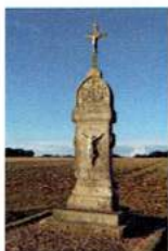
E - Calvaire vers Étampuis