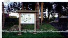
F - Aire de repos de Louvilly